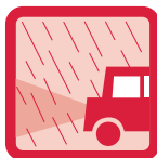
우천시, 저녁 때 헤드라이트